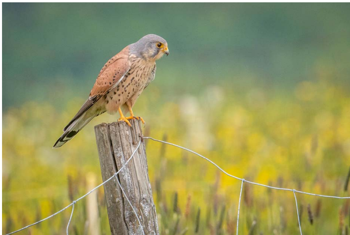
Turmfalke (Männchen) auf dem Hafnerberg